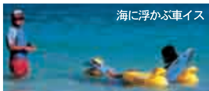
海に浮かぶ車イス