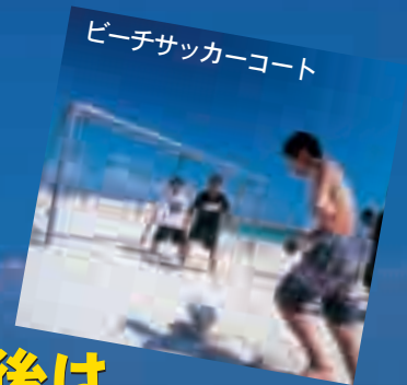
ビーチサッカーコート

あざまサンサンビーチでは ビーチ遊びを楽しんでもらえるように 海ではシーカヤックや足こぎポート 浜辺ではビーチサッカー、バレーのスポーツや 多目的広場もあり、更衣室、身障者トイレなど ビーチ施設も充実。 その他、ハブクラゲ防止ネットで安全性も 万全なので、ご家族、グループなど 安心して、たっぷり遊べます。