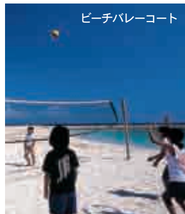
ビーチバレーコート