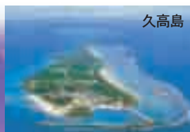
斎場御獄(セーファウタキ)